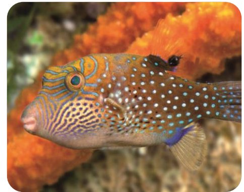
Durch den Parasiten Argulus infizierter Fisch